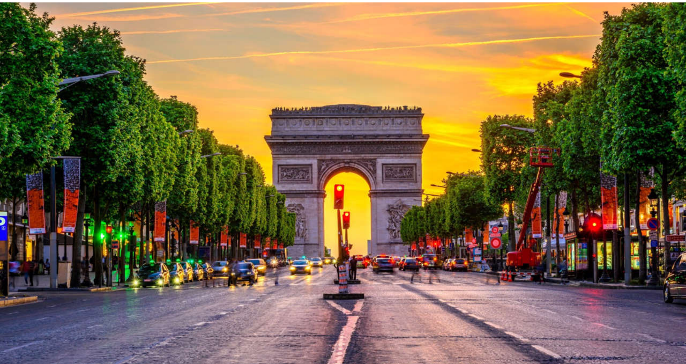
Vítězný oblouk – na konci ulice Champs-Élysées postavený Napoleonem na počest vítězné bitvy u Slavkova