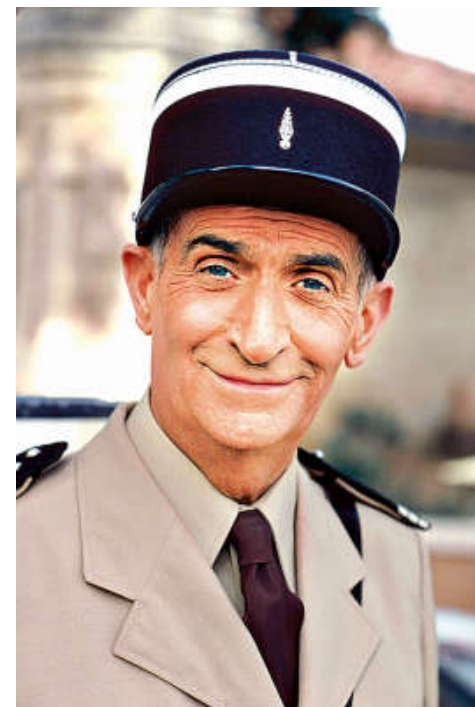
Louis de Funès