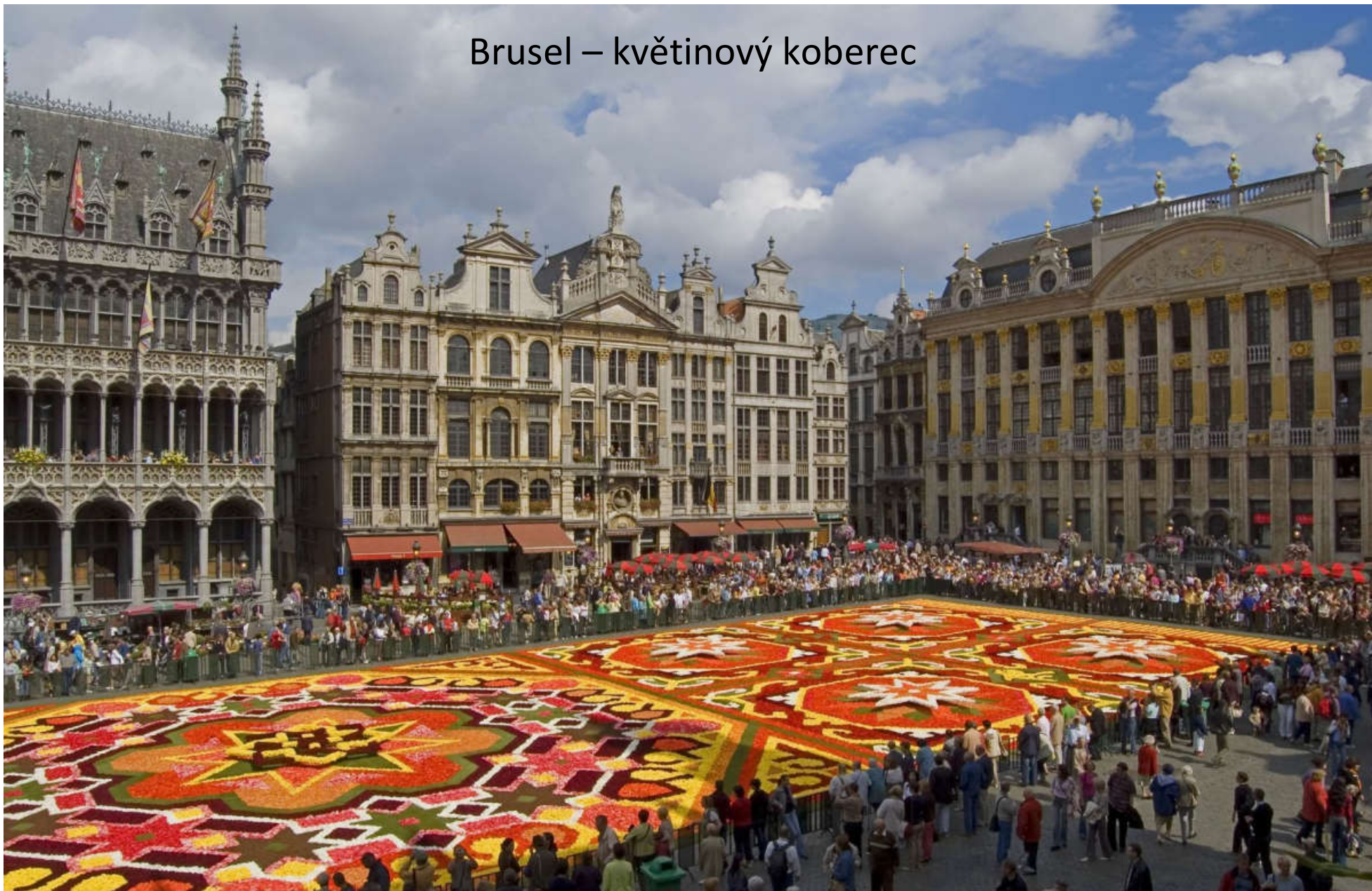
Brusel – květinový koberec