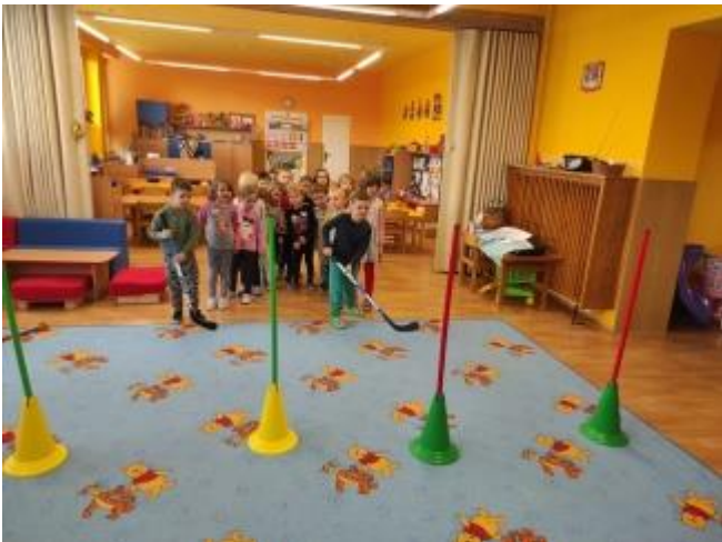
Projekt Se Sokolem do života 4