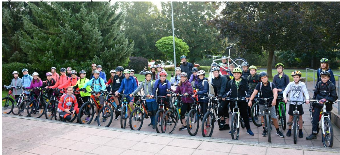
Cyklistický kurz v Hostýnských vrších