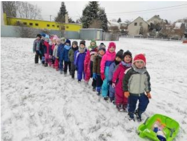
Projekt Se Sokolem do života 2