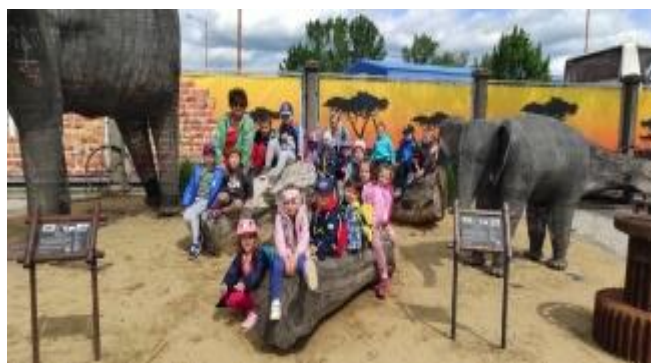
Exkurze do KOVOZOO- EVVO výuka