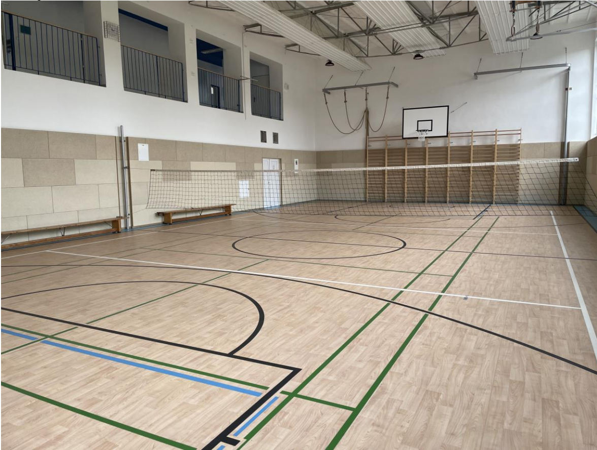
Nová podlaha a obložení