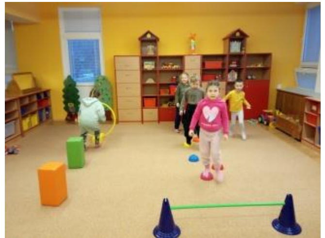
Projekt Se Sokolem do života 3