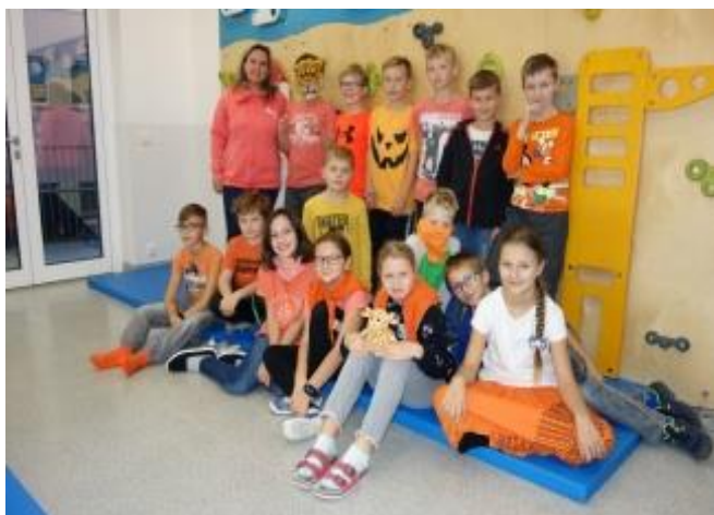
Adaptační pobyt 5. ročníku