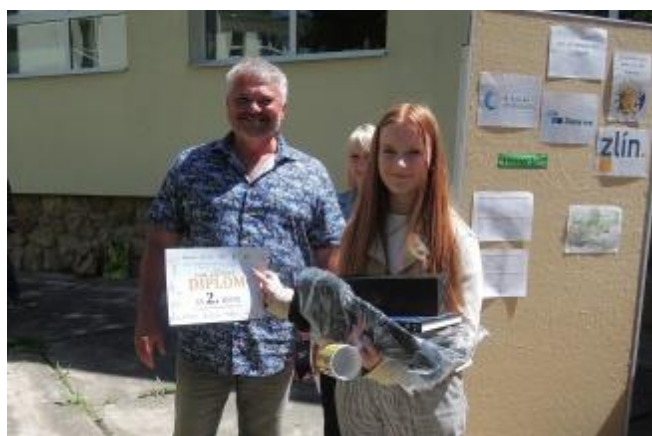
Okrskové kolo recitační soutěže